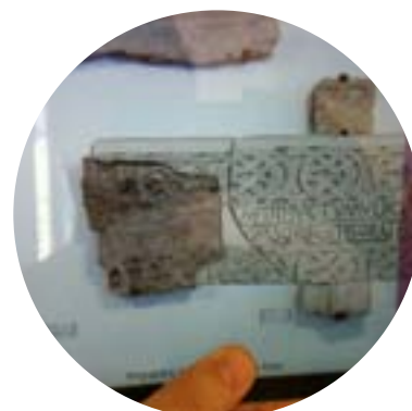
Ricostruzione virtuale in realtà aumentata Museo Archeologico di Torcello (VE)