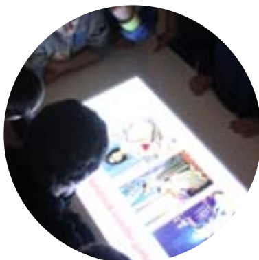
Nel cerchio dell'arte, Bolzano (BZ)

La tipologia di allestimento potrà essere verificata con un sopralluogo.