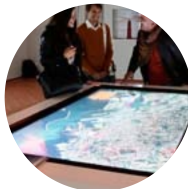
Livorno Port Center